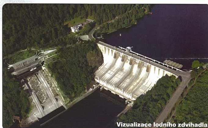
Vizualizace lodního zdvihadla